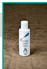
SL108 ROZTOK NA POKOŽKU Balení 118 ml a 944 ml

SL108 je roztok, který poskytuje pokožce ochranu bariéru a zároveň jí umožňuje dýchat. Usnadňuje nasazení lineru.