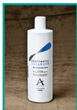
PD595 ČISTICÍ PROSTŘEDEK PRO ČIŠTĚNÍ PROTÉZ Balení 472 ml